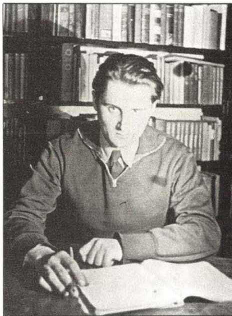
Szabadulás után. A szerző 1960-ban

Okt. 26. Ezen a napon, ha jól emlékszem, egész nap otthon voltam. Felhívtam barátaimat, ők pedig engem, s meghánytuk-vetették a politikai helyzetet. Bizako-